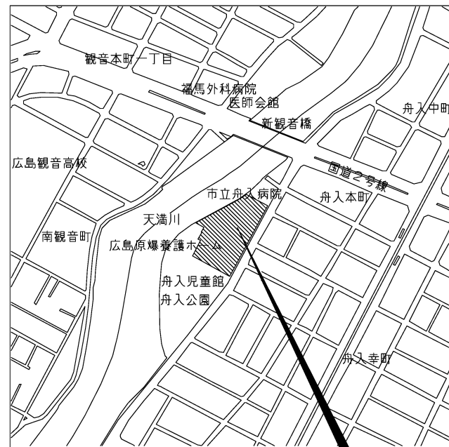
工事場所 中区舟入幸町 (広島市立舟入市民病院)