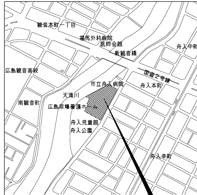
付近見取図 工事場所 中区舟入幸町 (広島市立舟入市民病院)